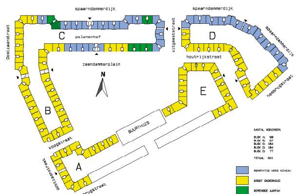
situatie met fasering

Het werk is in fases per blok uitgevoerd, waardoor de overlast voor de buurt beperkt bleef. Bewoners kregen de mogelijkheid om door te schuiven naar een al opgeknapte woning. Door de fasering is het mogelijk geweest om tijdens het uitvoeringsproces verbeteringen door te voeren.