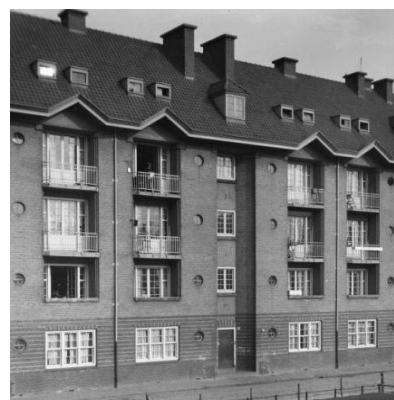
← gerenoveerde voorgevel 2008